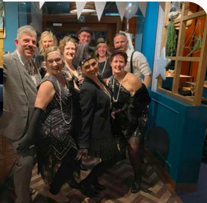
Personeelsfeest 2024 The roaring "25" themafeest.