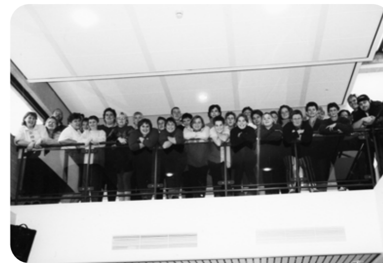
Collega's van De Witte Mol in 1999 & 2024 Zot doen is nog altijd een basishouding