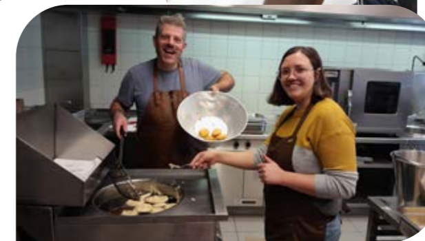
Appelbeignets bakken voor alle zorggebruikers en medewerkers van De Witte Mol? Tuurlijk dat doen we in 1-2-3