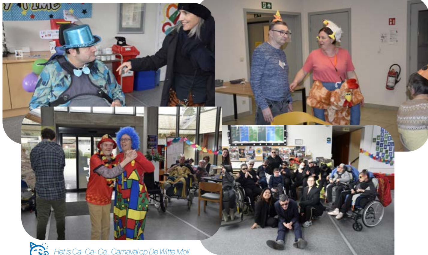
Het is Ca- Ca- Ca... Carnaval op De Witte Mol